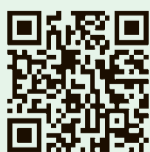
小平市よくある 質問サイト