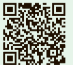
小平市 ホームページ

小平市ホームページでは、新型コロナウイルス感染症に関する情報を掲載しています。市報こだいらなどに掲載したイベントや講座、会議、公共施設の開館状況などは、変更・中止・延期になる場合があります。小平市ホームページから最新の情報をご確認ください。情報は、随時更新します。