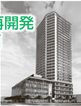
ビル完成イメージ

小川駅西口地区市街地再開発組合と市では、令和5年度の再開発ビル着工に向けて、準備を進めています。パネル展では、これまでの検討状況を踏まえ、再開発ビルや駅前(交通)広場などの施設計画を紹介し