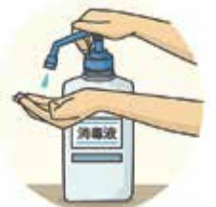
(内閣官房、厚生労働省ホームページより)