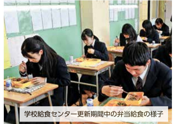
学校給食センター更新期間中の弁当給食の様子