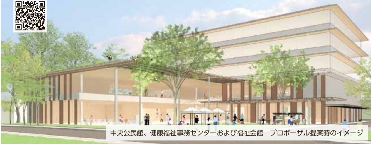
中央公民館、健康福祉事務センターおよび福祉会館 プロポーザル提案時のイメージ