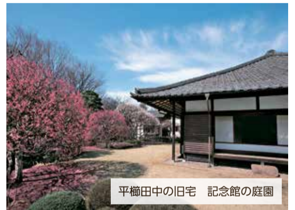
平櫛田中の旧宅 記念館の庭園