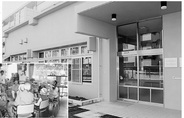
デイサービスのようす

市では、在宅介護の充実に向けて通所介護(デイサービス)を提供する拠点として、都営花小金井四丁目アパート2号棟内に、小平市高齢者デイサービスセンターを開設します。この施設は、市が現在進めている高齢者保健福祉計画の重点施策の一つである「地域ケアシステムの構築」のための基盤整備事業として、4月1日から事業を開始します。サービス内容などは次のとおりです。気軽に問い合わせください。