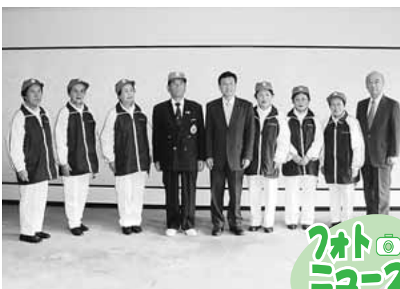
全国選抜ゲートボール大会へ小平市ゲートボール連盟チーム

第20回全国選抜ゲートボール大会（5月28日（土）・29日（日）、新潟県新発田市）に東京都代表として出場する小平市ゲートボール連盟所属の「小平なかよし」の選手・役員の方々が、市長を表敬訪問しました。 市長からは、「全国大会でいい結果を残して、ぜひその報告にもいらしてください」と激励の言葉がかけられました。