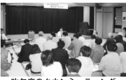
昨年度のタウンミーティング